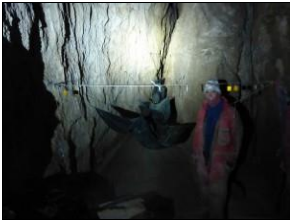
Búcsú a bivaktól Botival

A házban azt a pálinkát visszavettük, amit még mi magyarok hagytunk ott régen. Egész héten nekem köszönhetően az alkohol hiánycikk volt. Bocsi! Délután még lendületben voltunk. Nem is vacsoráztunk. Inkább átvittünk pár kiló felszerelést a Gilberti-házhoz. A Canin arról szól, hogy cuccolsz innen-oda. Akár felszínen vagy, akár a mélyben... A házban nagyon kedvesek voltak, valakinek a születésnapja volt és minket is megkínáltak tortával. 1-2 sör és elég volt bőven nekünk :). Sötétedéskor a turisták csak azt látták, hogy négy magyar nagyon vidáman baktat felfelé a hágón. Modor időnek hitte a magasságmérő állását.