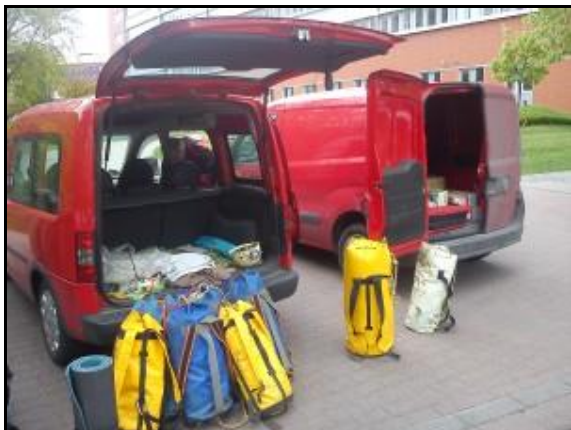
Indulás előtt még Lágymányoson