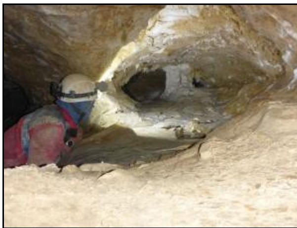
Modor és egy fosszil Boegan előtt