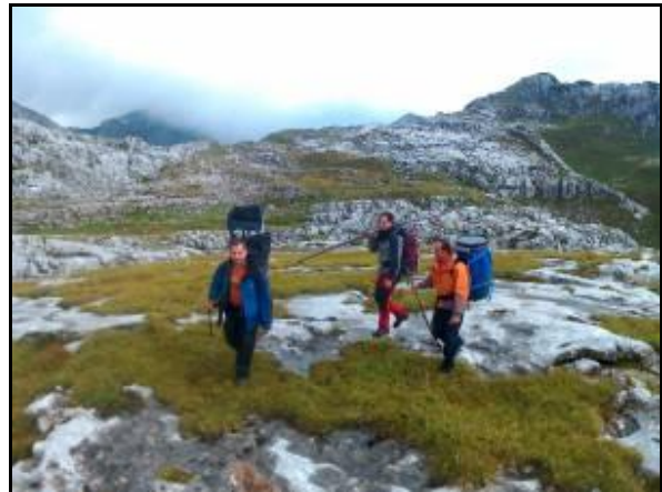
A régi táborhelyről az új táborhely felé