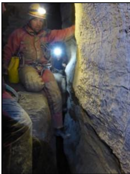
Lac a Boegan előtti szűk meanderben