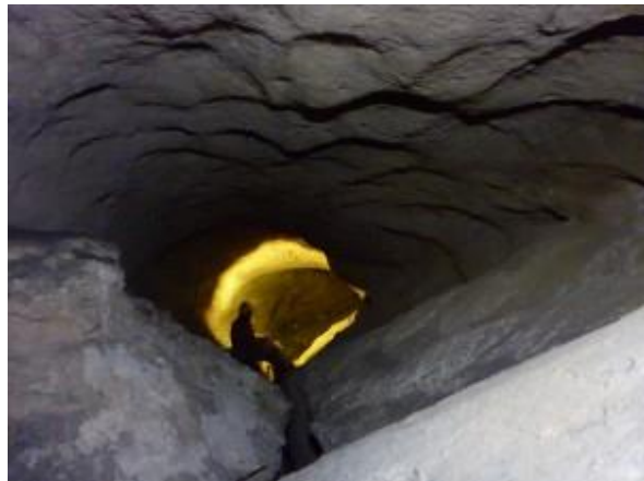
ET5 fosszil térképezése