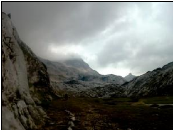
Esőre állt az idő, úton a Boegan-katlan felé

Szóval ők is mentek pár kiló felszerelésért a házhoz, hogy aztán elhozzák a táborba. Az új táborhely egyébként közelebb van a házhoz, és a Prez bejáratához is. (Régebben is a Boegan-katlan adott otthont a magyar barlangászoknak nyaranta.) Esőre állt az idő. Pár flakont megtöltöttünk a szikláról összegyűjtött vízzel. Majd mivel nem találtunk elég havat, és a hét további részére száraz időt jósoltak: elmentünk a régi táborhelyre elhozni a műanyag kannákat. Ott sajnos azzal szembesültünk, hogy az egyik hordó teteje felnyílt és a tartalma elázott. Estére visszaérve alaposan rákezdett az eső. Lac mesélte, hogy a szikláról lefolyó esővizet nem bírta elnyelni a tölcsér, amikor fel akarta tölteni a kannákat. Volt, hogy kis jégdarabok estek; volt, hogy mint a pingvinek álltunk a sebtében kifeszített ponyva alatt; volt, hogy a ködben alig láttunk sáttortól-sátorig.