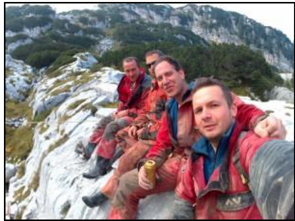
Modor, Lac, Boti és