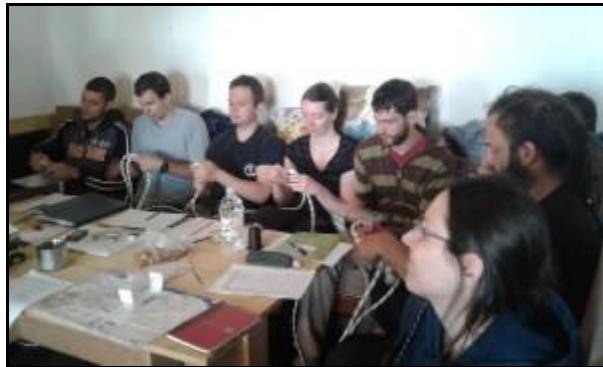
Tanfolyamosok (Németh András képe)

Elméleti előadások napja olyan témákban mint pl.: beszerelés, beszerelési vázlat, húzórendszerek és kötelek.