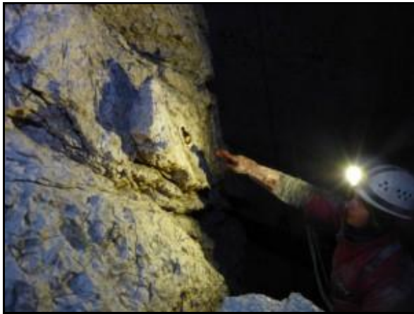
ET5 aknában a régi standgyűrű

Odaát sajnos pár méter múlva véget ért a járat. Aztán arra lettünk figyelmesek, mintha felettünk-oldalt, ezt az irányt tartva, egy felső-oldalsó szűkebb hasadék tartott volna az aknából kifelé... Boti és Lac visszatért térképezni. Ferdén felfelé, szándékosan az akna felé (hogy oda is beláthassunk), traverzálva, fúrva, kihasználva a beszorult köveket Modor mászott felfelé kb. 20-25m-t. Egy olyan ponton hagytuk abba aznap: ahol kifogytunk a felszerelésből, ill 1. Ny-i irányba beláttunk az aknába, velünk egy magasságban 2-3 ígéretes ablakkal nem nagyon távol a túloldalt (kb 15-20m); 2. K-i irányba elszűkülve tart a hasadék oldalra-felfelé tovább. Azt hogy holnap merre menjünk komoly dilemma volt. Ez volt a harmadik nap odalent, még csak most tudtunk továbbmenni onnan ahol tavaly abba hagytuk, és már csak egy munkanapunk volt, felszerelésből kezdtünk kifogni. 20:08 körül ásítottunk a sátorban, úgyhogy le is feküdtünk aludni.