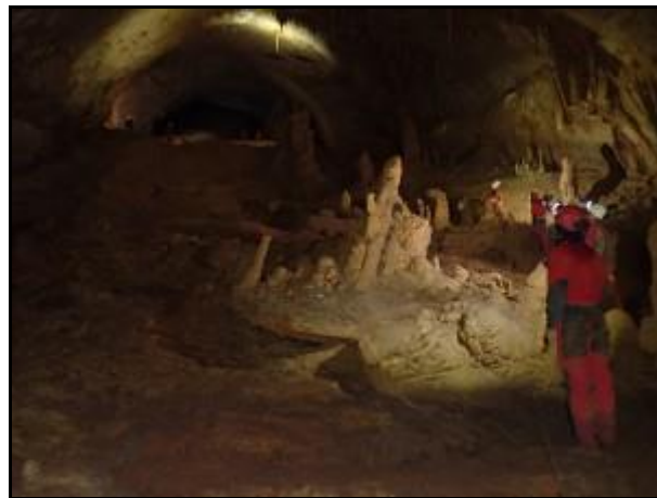
Lipiška jama alsó szakasza

Vasárnap szinte minden magyar a Lipiška jamába ment. (Más opciók az idegenforgalmi Škocjan ill. Divaška jama voltak) A Lipiška: Lipica közelében található. Előtte útba ejtettük a Lipica I-es számú kőfejtőt is. Maga a barlang kitett, kapaszkodó köteles, kisebb aknával indul. A nagy bejárati terem után cseppkőképződményekben gazdag nagy termekben túrázhatunk. A barlang alsó szakasza jellegében más. Egy tágas, félkör metszetű járat tart enyhén dőlve a mélybe. A fekü üledék. Ez is igen látványos azért. A túra után emberhez méltatlan esőben pakoltunk össze és indultunk haza.