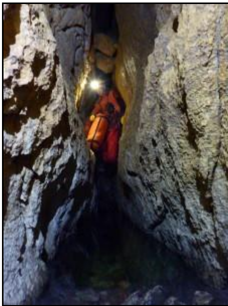
Lac a lefelé bivakhoz

Hétfőn búcsút vettünk egymástól. A bivakoló csapat már nem találja a felszínen az Increduli csapatot pénteken, ők ugyanis szerdán elmennek... Kényelmes ébredéssel, indulással és érkezéssel elértük a -420m-e levő bivakot délután. Minden érintetlen volt odalent tavaly óta. A sátor ugyan kicsit nedves volt, de sikerült később kiszáritanunk. Pár napra száraz időt mondtak. Általában az eső délután-este szokott leesni. Ezért Lac kezdeményezésére ráálltunk a korai fekvésre és korai ébredésre. Ez a bivak olyan, hogy a kezed kinyújtod a sátorból és csapból jön a víz! 20:00 lámpaoltás.