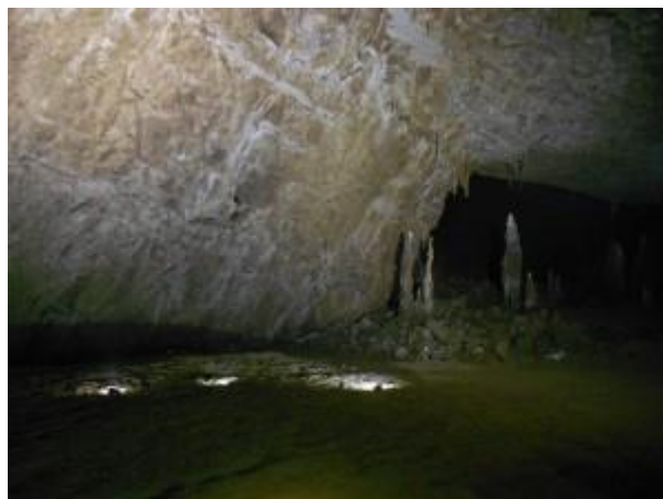
bejárat szakasz egyik lenti folyosó része

Ezután már csak el kellett viselni egy 5 órás fotózást, ahol viszont nem 5, hanem 722 fotó készült. Közben meg az akkuk is merültek, folyamatosan cserélgettük a reflektorokon.