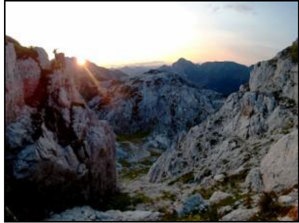
Naplemente a Sella Bila Pecen (hágó)