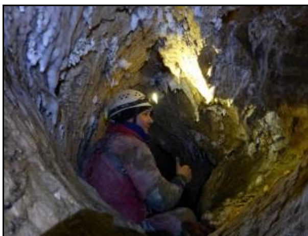
Az új rész ilyen látványosan indul