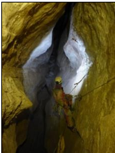
Modor és a K-i irány