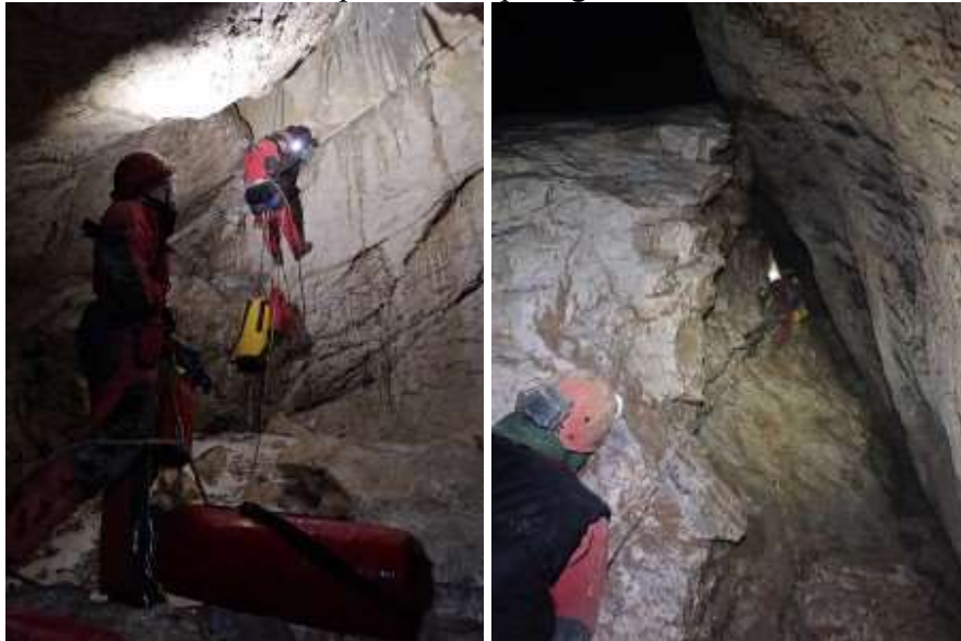
egy kép valahol cuccolás közben a barlangból és kürtőmászás alsó része

értük utol Kagyóék csapatát, akik kürtőt másztak az Eredendő bűn feletti részen. Itt egy apróbb fennakadás következett az amúgy kiválóan végzett mérésben, ugyanis elfelejtettem külön mappát csinálni a pda-n a mérésünknek, amit a PocketTopo nem szeret ezért gyorsan össze is keverte egy másik méréssel, ami már korábban benne volt a mappában. Szitkozódás, felelős keresés, majd néhány mély levegő vétel után megegyeztünk abban, hogy habár az adatok menthetőnek tűnnek, mégiscsak jobb lenne újra felmérni a napi szakaszt egy megfelelő file-ban. Ezt is tettük. Viszont valamit mégiscsak tanultunk napközben ugyanis visszafelé már feleannyi idő sem telt el, mint először, mire visszaértünk az akna talpon lévő 0. pontig.