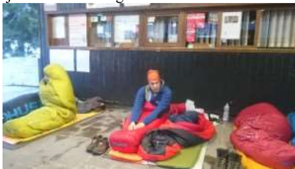
ébredés a régi felvonónál

Reggel 8 körül ébredtünk. Ébresztőre nem nagyon volt szükség, hiszen eddigre már megérkeztek az első síelők is, akik a fejünk mellett sétálgattak.